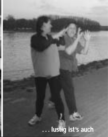
... lustig ist's auch