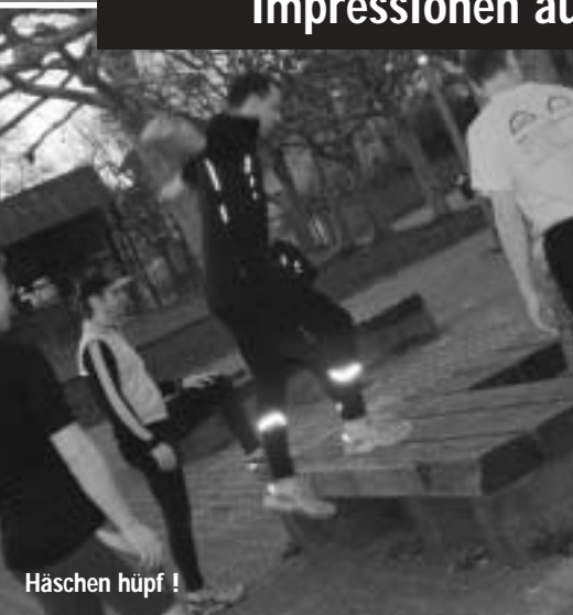
Häschen hüpf !