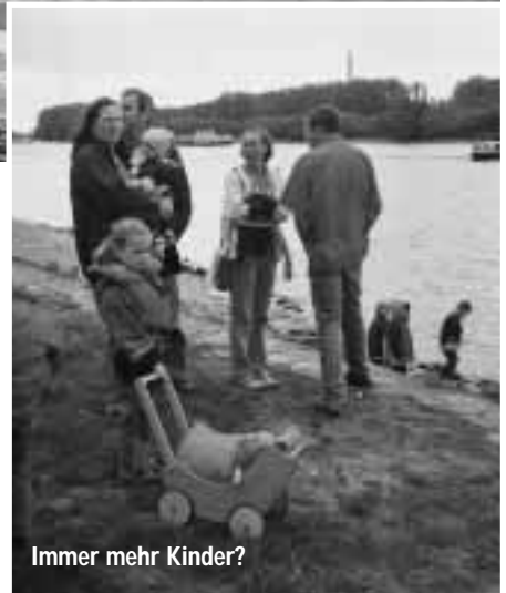
Immer mehr Kinder?

Die RWB-Mitglieder müssen sich nicht den Kopf zerbrechen, wohin der Ausflug am ersten Mai hingehen soll – natürlich trifft man sich an diesem Tag am Bootshaus in Biebrich. In diesem Jahr entschlossen sich besonders viele Ruderer für das Anrudern, kein Wunder viele waren schon richtig ausgehungert nach ihrem Lieblingssport, denn wochenlang ging gar nichts, das Bootshallentor in Schierstein war defekt und der Bootssteg in Biebrich wurde mal wieder saniert, diesmal schwimmt er nach den Arbeiten besonders gut, hoffentlich etwas länger als sonst. Den Helfern vielen Dank!