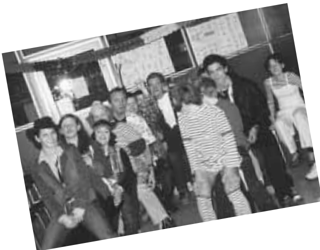
Faschingsparty im Bootshaus: