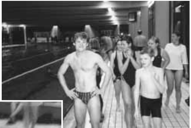
Viel Wasser, viel Spaß: Giessener Schwimmfest