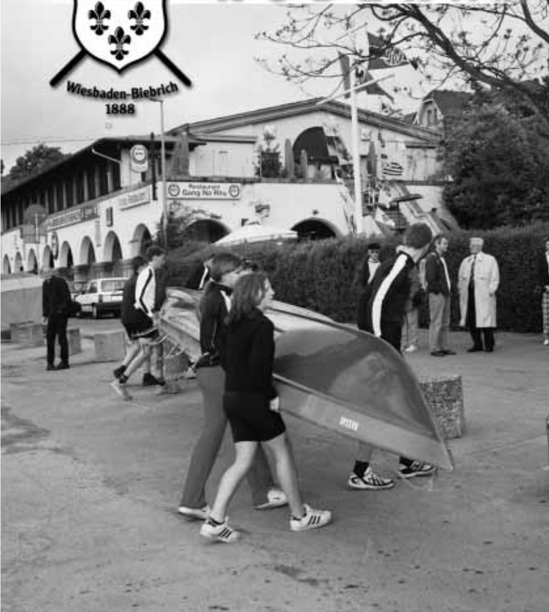
Großer Andrang beim Anrudern 2003