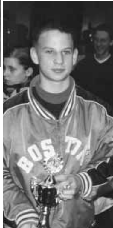
Pokal für den Sieg in der 8x50m-Staffel