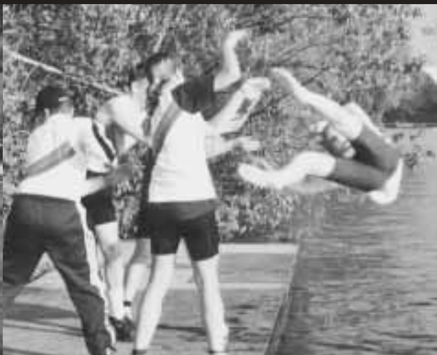
Nikolas-Flug: Eisernes Gesetz - eiskalte Landung: Wer steuernd siegt, der fliegt